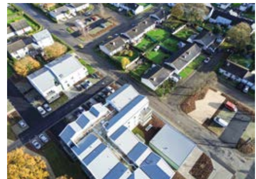
Aménagement d'un parking, place Pierre de Dreux

L'achèvement des 9 pavillons actuellement en construction est prévu à l'automne 2026, ce qui viendra compléter progressivement la physionomie du quartier.