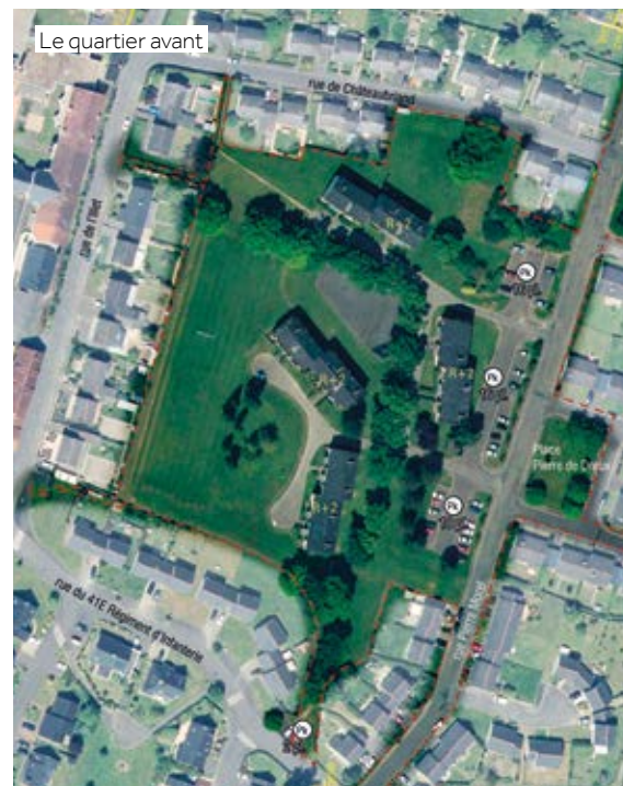
Le quartier avant