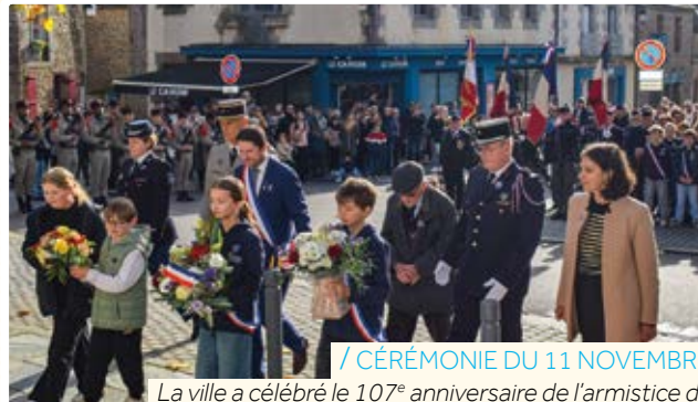
/ CÉRÉMONIE DU 11 NOVEMBRE

À l'occasion de ses 10 ans, Off'On ! est revenu sur une décennie d'aventures musicales, d'instantanés partagés et de moments forts à travers une sélection de photographies retraçant ses événements marquants. Concerts, conférences, coulisses et souvenirs collectifs : cette exposition à la médiathèque et au Bardac' a célébré l'énergie et la passion qui animent l'association depuis 2015.