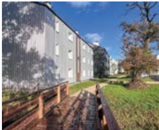
Un des bâtiments rénovés

Une salle commune, voulue par la municipalité pour créer un véritable lieu de vie au cœur du quartier, a également été réalisée. Baptisée « La Ramoucele », un mot gallo qui évoque l'idée de « rassembler », elle accueillera à la fois des moments conviviaux pour les habitants et des activités associatives, selon des modalités d'usage qui seront précisées prochainement.