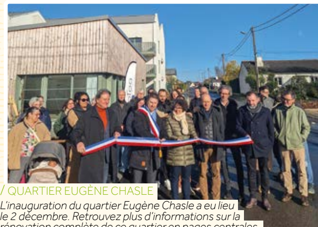
/ QUARTIER EUGÈNE CHASLE

L'inauguration du quartier Eugène Chasle a eu lieu le 2 décembre. Retrouvez plus d'informations sur la rénovation complète de ce quartier en pages centrales.