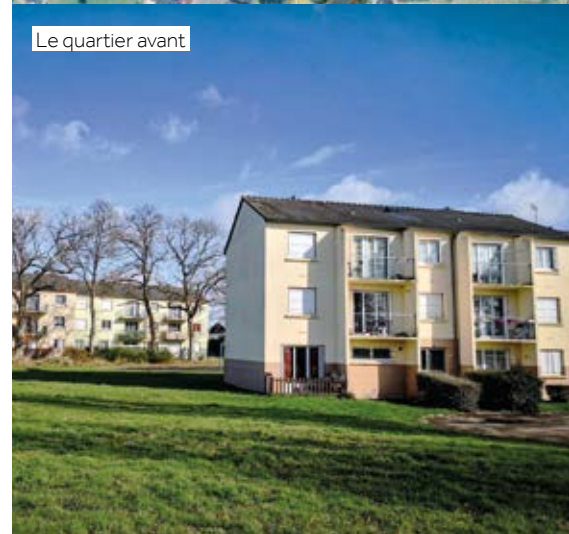
Le quartier avant