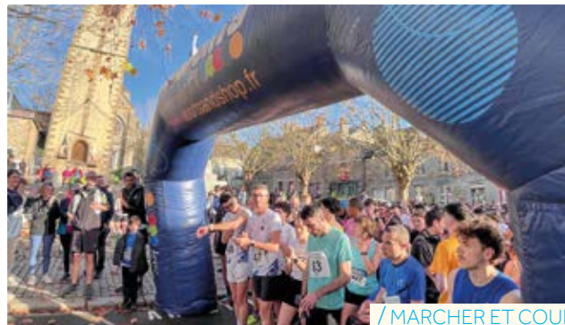
/ MARCHER ET COURIR POUR LA BONNE CAUSE

La ville a célébré le 107 e anniversaire de l'armistice du 11 novembre 1918 et rendu hommage à tous les morts pour la France.