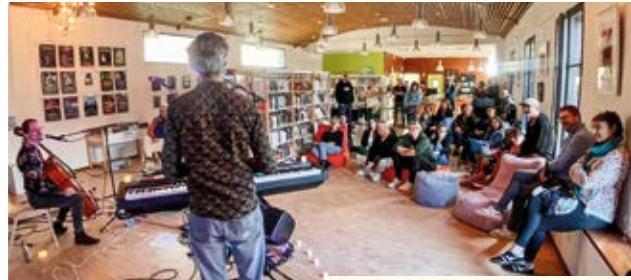
/ EXPOSITION PHOTO OFF'ON !

Altin Gün, groupe international de renom, accueilli dans le cadre du festival Le Grand Soufflet, a fait salle comble à l'Espace Bel Air (770 entrées).