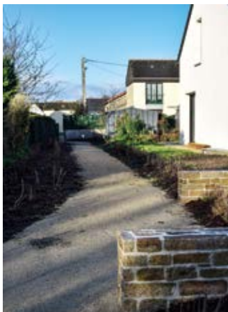
Création d'une liaison douce vers la rue de l'Illet