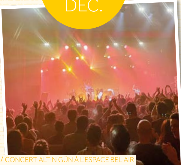
/ CONCERT ALTIN GÜN À L'ESPACE BEL AIR

Altin Gün, groupe international de renom, accueilli dans le cadre du festival Le Grand Soufflet, a fait salle comble à l'Espace Bel Air (770 entrées).