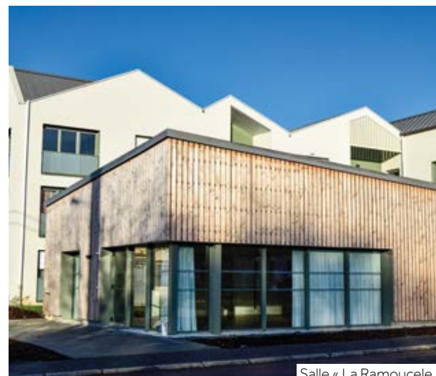
Salle « La Ramoucele »