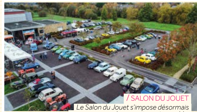
/ SALON DU JOUET

Cérémonie de la Sainte-Barbe au centre de secours de Saint-Aubin : un grand merci à nos sapeurs-pompiers volontaires, 16 femmes et 31 hommes, pour leur engagement et leur dévouement au service de la population !