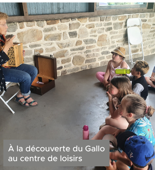
À la découverte du Gallo au centre de loisirs