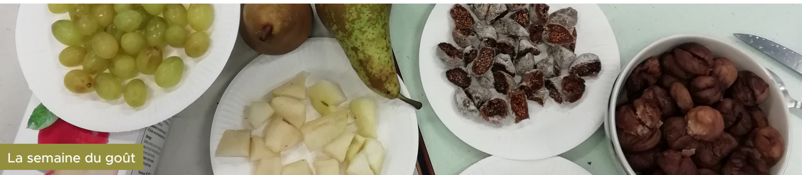
La semaine du goût