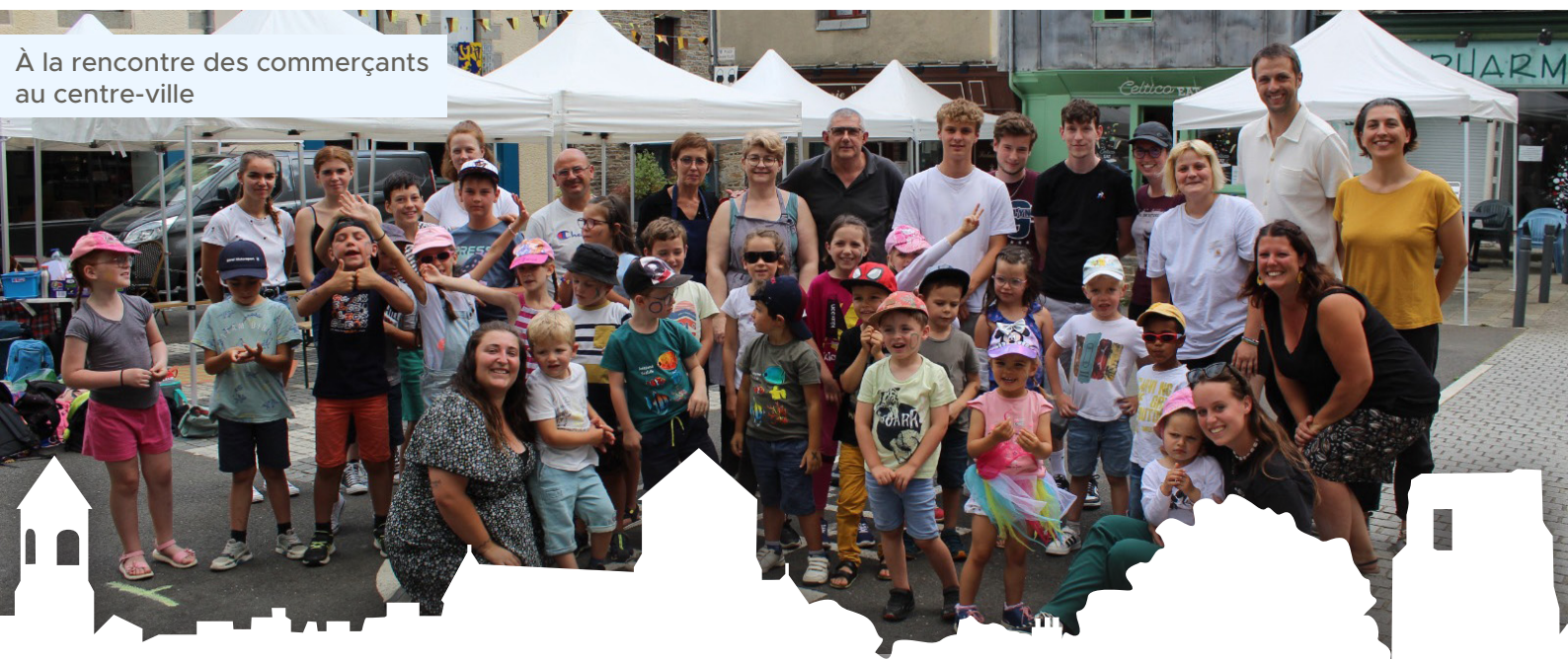
À la rencontre des commerçants au centre-ville