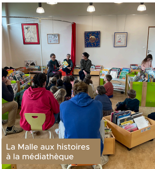
La Malle aux histoires à la médiathèque