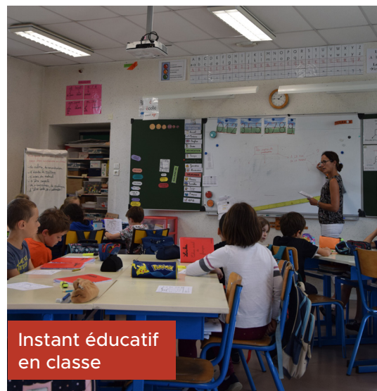
Instant éducatif en classe