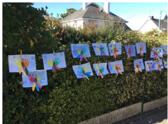
«La grande lessive» Octobre 2021

Une école qui accueille l'enfant et sa famille dans un environnement sécurisant