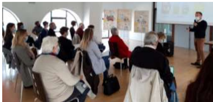
EDF Solidarité, les écocgestes à la maison 12 octobre